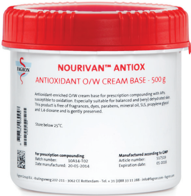
CNK 3079-704 500 G